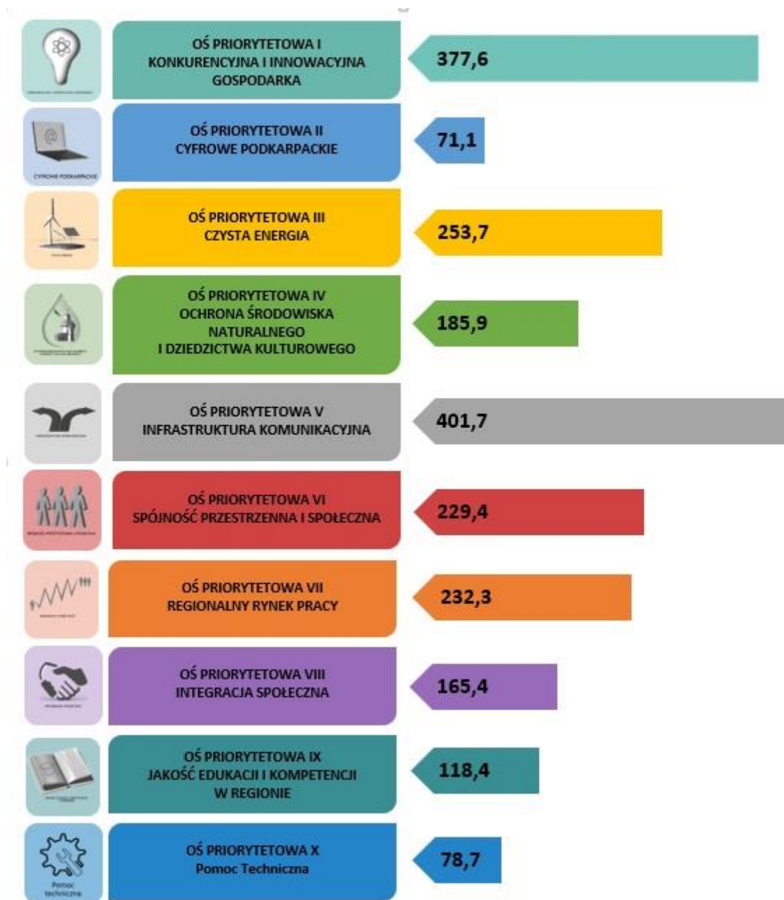
Rysunek 1. Podział alokacji w ramach RPO WP 2014-2020 (alokacja w mln EUR)

W pracach nad RPO WP 2014-2020 wykorzystano szereg wyników badań ewaluacyjnych wynikających z dotychczasowego dorobku ewaluacji z lat 2007-2013. Przede wszystkim w konstruowaniu szczegółowego zakresu interwencji przydatna była Ewaluacja ex-ante Regionalnego Programu Operacyjnego Województwa Podkarpackiego na lata 2014-2020 . W oparciu o wnioski z diagnozy wyzwań, potrzeb i potencjałów regionu ustalono, że realizacja celu głównego będzie wymagała wdrożenia dziesięciu osi priorytetowych.