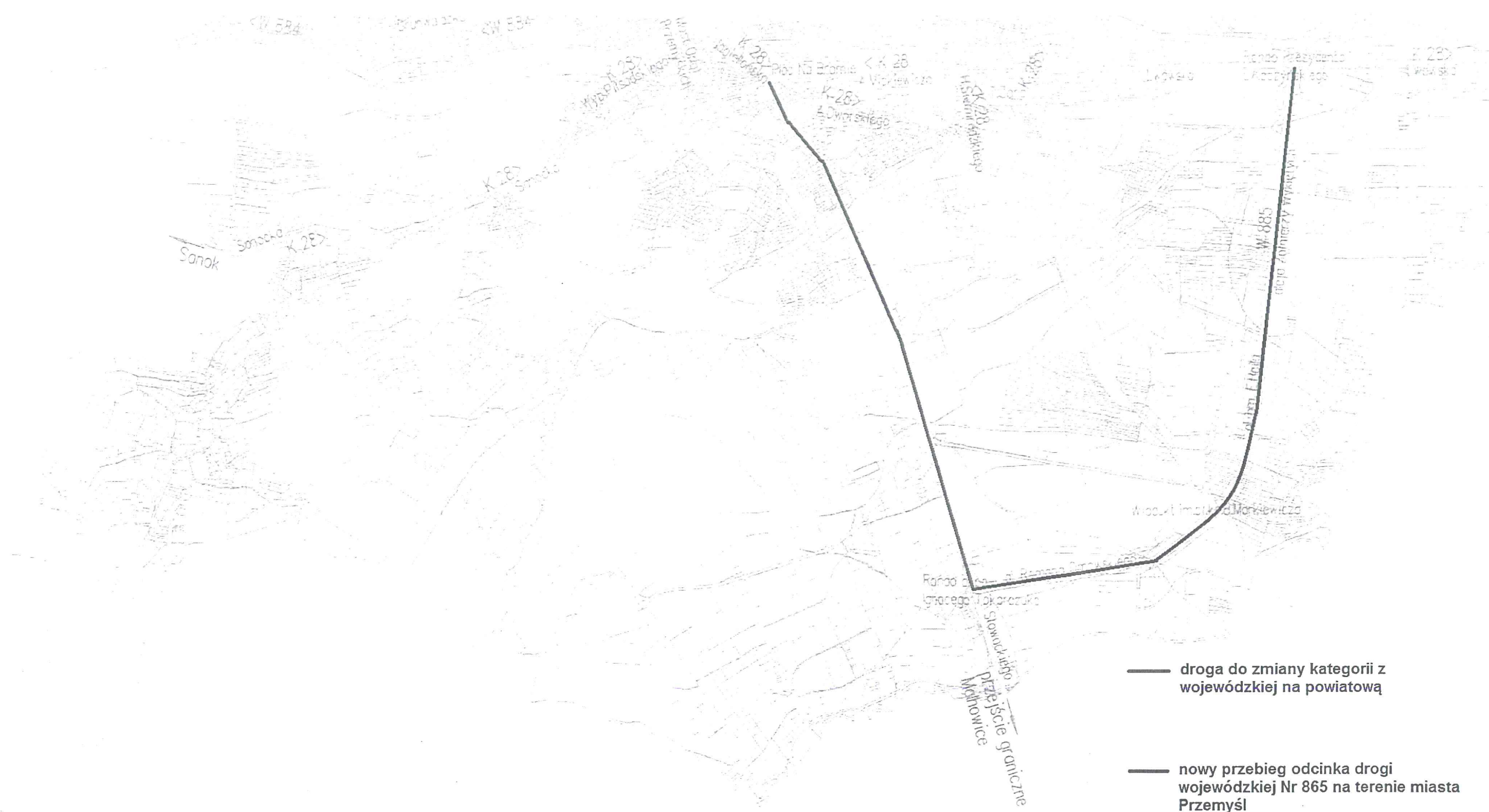
Załącznik Nr 1 do Uchwały Nr Sejmiku Województwa Podkarpackiego z dnia