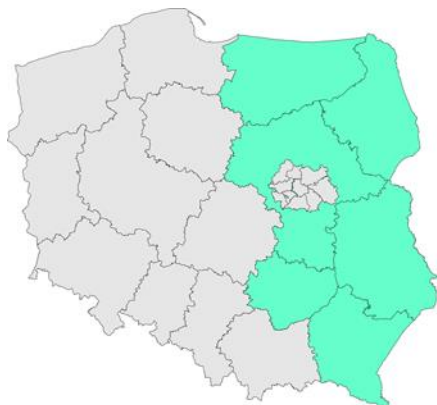
Mapa: 6 regionów statystycznych Wschodniej Polski