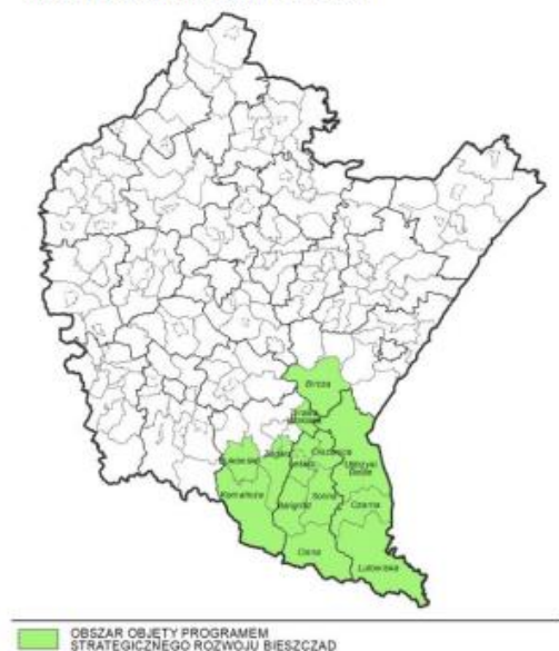
Mapa 19. Obszar objęty Programem Strategicznego Rozwoju Bieszczad