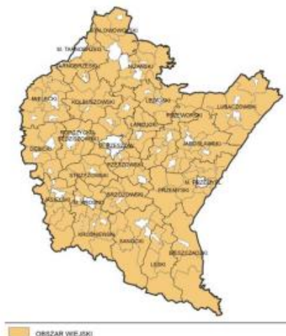
Mapa 21. Obszary wiejskie województwa podkarpackiego